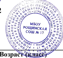
ГРАФИК РАБОТЫ ДОП. ОБРАЗОВАНИЯ на 2022 -2023