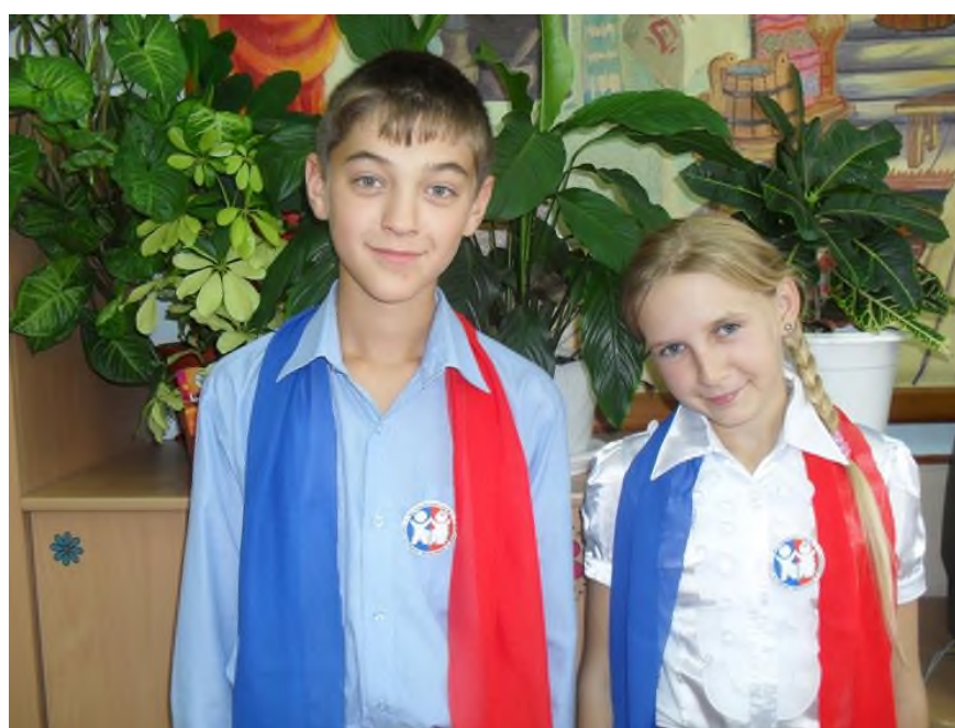
Символы и атрибуты: двуцветный шарф (сине-красный), эмблема, значки